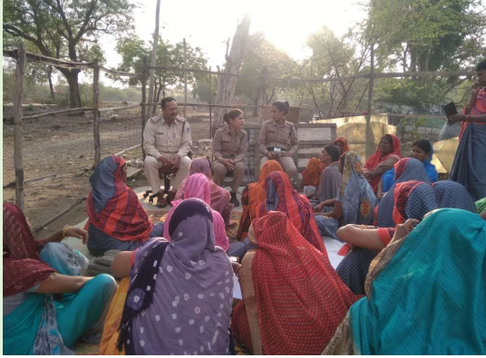
थाना पिपलानी के अंतर्गत चोंदबाडी बस्ती मे शक्ति समिति की बैठक