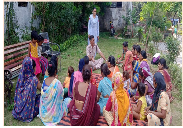
थाना कमला नगर के थाना परिसर में शक्ति समिति की बैठक