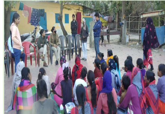
थाना मिसरोद के अंतर्गत जाटखेडी बस्ती मे शक्ति समिति की बैठक