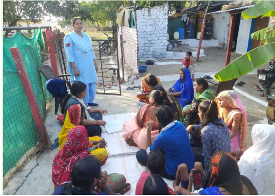
थाना अवधपुरी के अंतर्गत बस्ती स्तर पर शक्ति समिति की बैठक