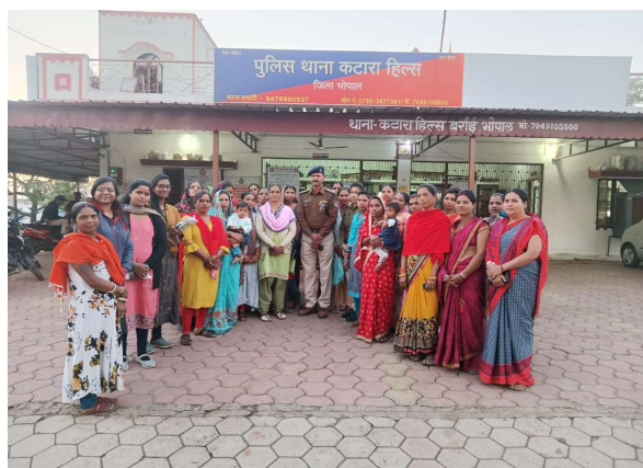
थाना कटारा हिल्स में शक्ति समिति की बैठक