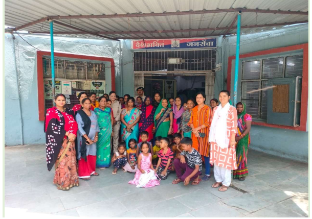
थाना कोलार के अंतर्गत थाने स्तर पर शक्ति समिति की बैठक