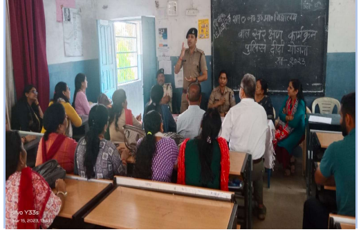
थाना मिसरोद के अंतर्गत पुलिस दीदी कार्यक्रम को लेकर स्कूल में बैठक