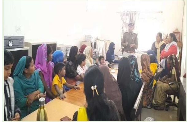
थाना पिपलानी के अंतर्गत थाने स्तर पर शक्ति समिति की बैठक