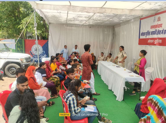
जनसंवाद युथ विंग की बैठक, थाना कमला नगर