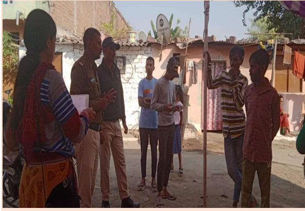
असुरक्षित स्थानों पर पुलिस भ्रमण के माध्यम से जागरूकता करते हुये