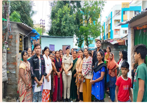
थाना कमला नगर के अंतर्गत बस्ती स्तर पर शक्ति समिति की बैठक