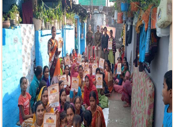
थाना कोलार के पुलिस अधिकारी द्वारा बस्ती में बैठक