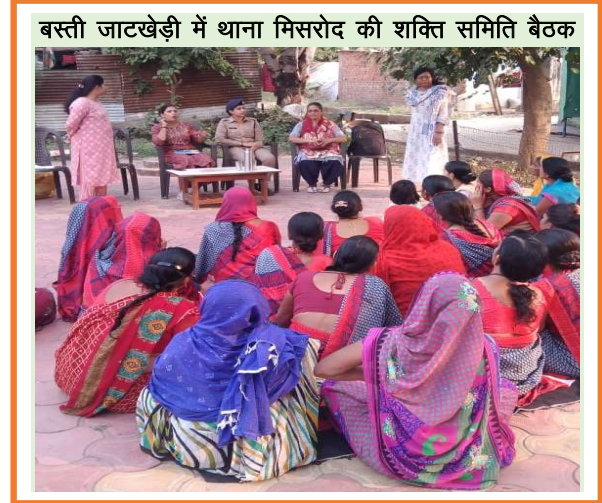
बस्ती जाटखेड़ी में थाना मिसरोद की शक्ति समिति बैठक