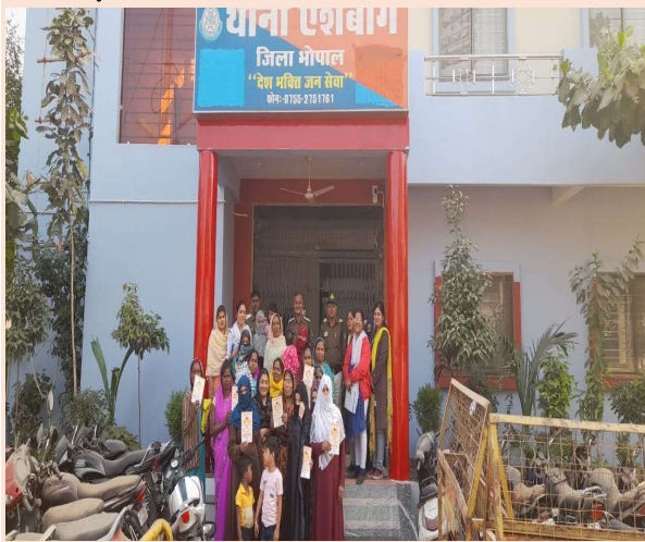
थाना ऐशबाग में शक्ति समिति की बैठक व शैक्षणिक भ्रमण