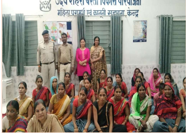
थाना मिसरोद के पुलिस अधिकारी द्वारा बस्ती जाटखेडी