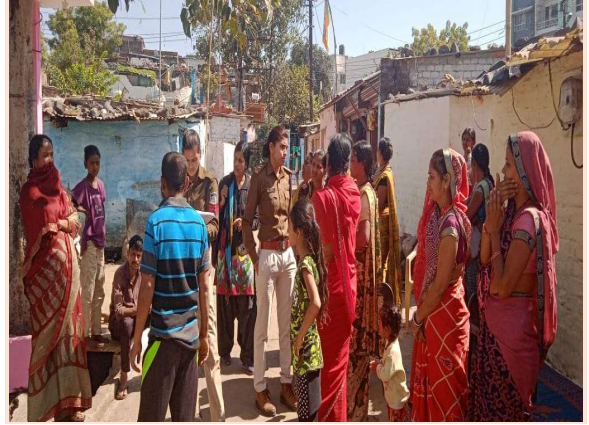
महिला पुलिस के माध्यम से बस्ती में हिंसा के मामले में चर्चा करते हुये