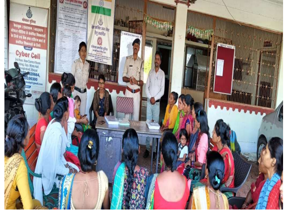
थाना कटारा हिल्स